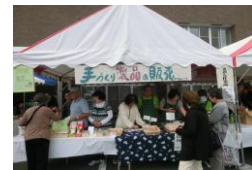
イベントでの販売