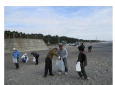
いいこと活動（海岸清掃）