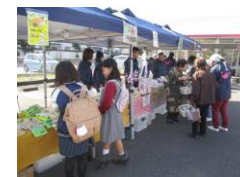
こころ市（自主製品販売）