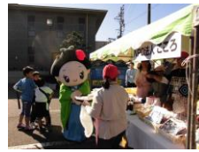
イベントでの販売