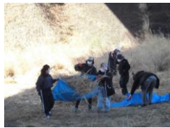
施設外作業（草刈り）