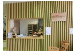
カフェ・きいちご

📞 さがら作業所 ：定員 20 名 月～金 9:00～16:00 ☎ 0548-52-7447