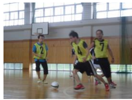
クラブ活動(フットサル)