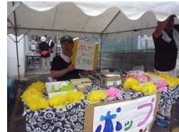
イベントでの販売