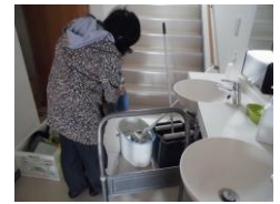
施設外支援（高齢者住宅清掃）

📞 ワークステップドレミ ：定員 20 名 月～金 9:00～16:00 ☎ 0547-37-7865