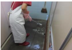
施設外支援（病院清掃）