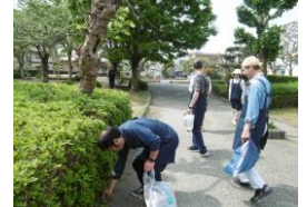
いいこと活動（公園清掃）

📞 いなむ ：定員 20 名 月～金 9:00～16:00 ☎ 0547-46-1687