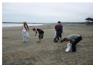
いいこと活動(海岸清掃)