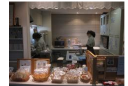
喫茶ル・ヴェール

📞 あじさい ：定員 20 名 月～金 9:00～15:30 ☎ 0548-22-5529