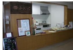
カフェ・みれっと