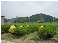
施設外支援（茶園管理）