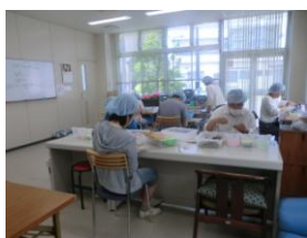
新作業場（島事業所）

毎月の定期作業となった1000部のポスティングも4月、5月と2回行い、ポストの場所や犬のいるおうち等が少しずつ分かってきたところです。雨降りが続いた5月は、貴重な晴れの日に1日頑張った方もいます。これから梅雨時期を迎えますが、みんなで協力してやっていければと思います。