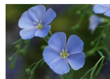
りなむ:アマ科の植物

平成24年度から名前を「りなむ」と変え心機一転 金谷本町にて利用者さんの働くことへのチャレンジが続きます。