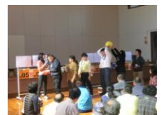
メディスングボール

最後のジャンケン大会では、チーム得点に加算があった為、更に盛り上がり、来期に繋がる交流会となりました。次回も多くの方の参加を期待しています。