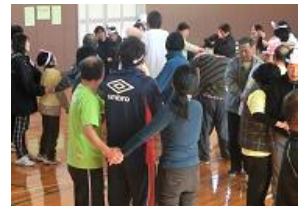
交流会での「タコとたこつぼ」

すばらしい出来上がりだったので当日まで“はぐるま”に飾りました。当日は練習の何倍もの大勢が参加してとても楽しくできて良かったです。「動いたのでいい運動になった。」「疲れた。」「おもしろかった。」などの感想が聞かれました。来年度も交流が出来たらいいな～と思いました。