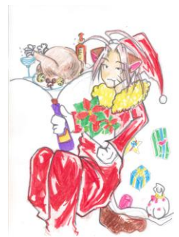
はぐるま利用者の作品