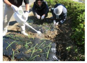
玉葱の植付け作業

「いずれ一般就労で働きたいからこれくらいは問題ない」、「こむぎに通うことで毎日のほりが出てくる」、「こむぎに通い皆と仕事をするのが楽しい」と各々こむぎに通う意義を見つけ「大葉の仕分け作業」、「花火の袋詰め作業」、「箱折作業」「古紙・アルミ缶の回収作業」等の仕事に励んでいます。