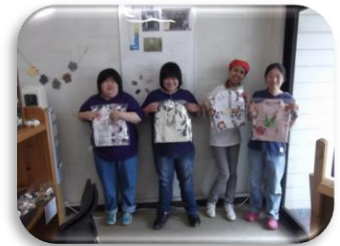
帯シャツを持ったメンバー