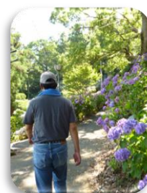
秋葉山公園での散歩