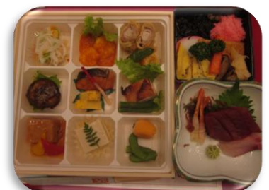
うおともさんの創作料理

からも「楽しかった」「自分達のために盛大に開いてもらってありがたい」と感想が挙がり、とても充実したひとときを過ごしました。