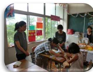
メンバーの体験コーナー

当日は、高校生も売り場の手伝いをしてくれ、とても賑やかな中、販売を行いました。体験コーナーには、小さいお子さんがたくさん来てくれ、ふれあいの時間をもつことができました。また、販売の担当時間でない時は、文化祭を見てまわることができ、メンバーからも楽しかったという声がきけました。