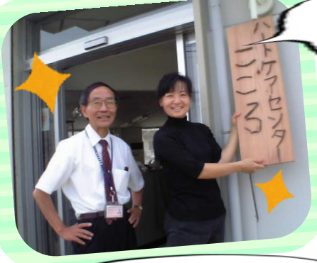
こころの原点！初代理事長と

こころが設立して18年...こころは、人と、地域とともに「思い」を紡いで活動してきました。 その思い出を写真とともに振り返ります。