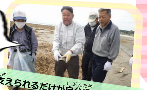
“支えられるだけが自分達じゃない！”

生活の木宇田川氏の講演会での「いいことすればいいんだよ」の合言葉のもと、各事業所、清掃やエコキャップ集め等、自分達にできる“いいこと活動”を行いました。