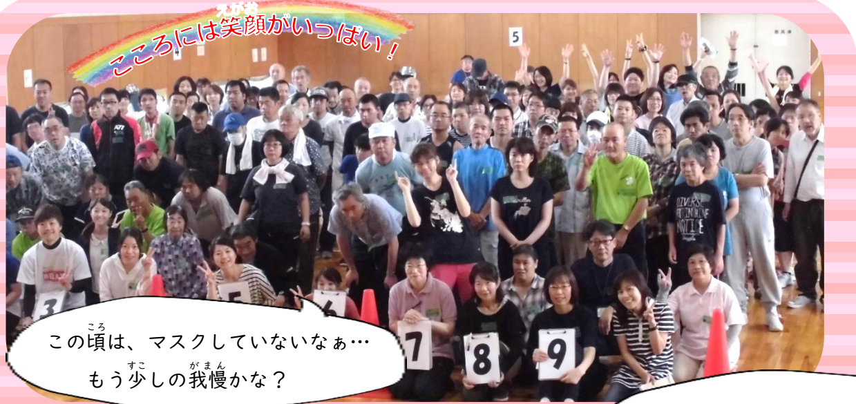
この頃は、マスクしていないなあ...もう少しの我慢かな？