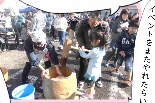
イベントをまたやれたらいいな！