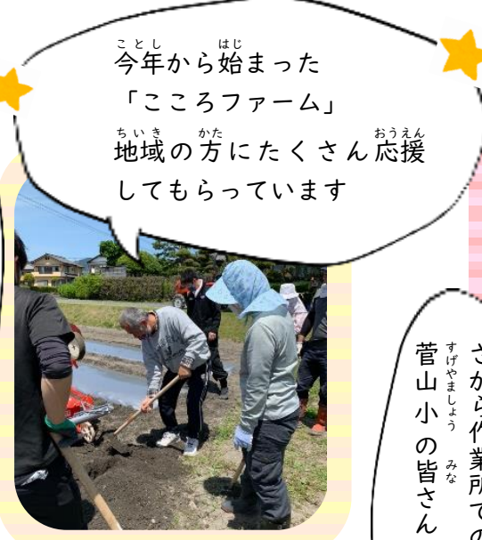
今年から始まった「こころファーム」地域の方にたくさん応援してもらっています