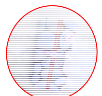
合格祈願クッキー

今年は1月18日で、りなむでは合格祈願クッキーの販売を行いました。島田観光協会からのお誘いで昨年参加させていただいています。今年もJR東海のさわやかウォーキングの方々が大勢石畳を通り思いがけない甘酒のサービスを喜ばれていました。