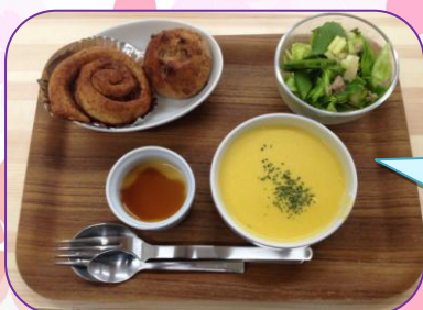
ワンプレートランチ