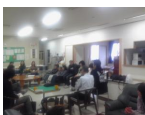
サロンミーティング