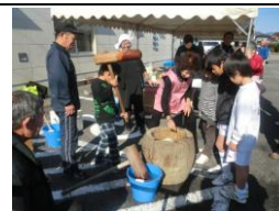
利用者の作品展示

県の「地域における施設の拠点機能活用事業」委託事業として12月18日に「餅ましよう あたたかいところ♥」をテーマに恒例のもちつき大会を実施しました。利用者・職員より実行委員を募り計画した結果約200名の来場者を迎えることが出来ました。又、関係者の皆様よりのバザー品の寄付、ボランティアの協力も有り会を盛り上げることができました。今年は食推協のご協力で島田汁のサービスもすることができました。