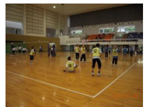
県ソフトバレー大会