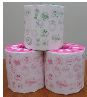
完成品 (シングルとダブル)

こころの事業所である就労継続支援B型事業所「あじさい」では回収業者と契約して家庭から出された牛乳パックを自治体、店舗などに出向き回収しています。回収品は製紙メーカーでトイレットペーパーに生まれ変わります。