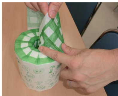
利用者によるトイレット ペーパー包装作業