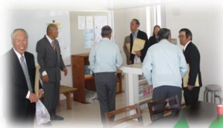
事業所移転開所式