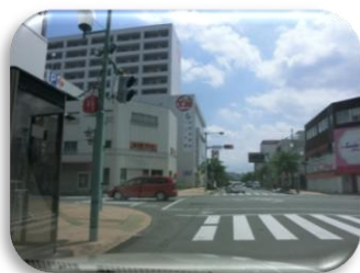
島田駅前 おびりあ

お客様の声に耳を傾け新しいメニューも増やしていきたいと思っておりますので、ご意見やリクエストをお待ちしています。