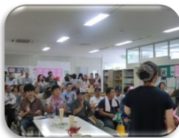
ステージ発表会場