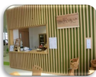
カフェ・きいちご全景