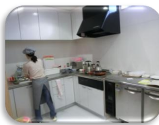
カフェ・きいちご厨房