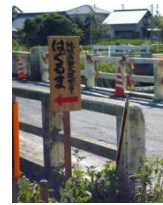
ボランティアの協力ではぐるま入口に看板を設置