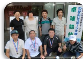
参加の利用者とスタッフ