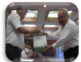
お米とお茶の寄贈式