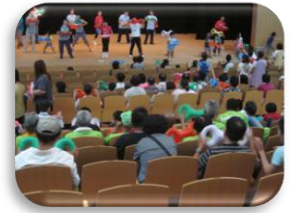
牧之原市福祉施設交流会