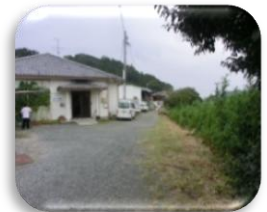
休日に牧之原市役所の課長さんに今年2回目の草刈をしていただきました。ありがとうございました。