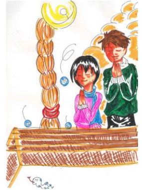
利用者の作品(初詣)

会場では化粧石けんなどの自主製品販売・風船ダーツ・輪投げなどのゲーム、メンバー・職員のカラオケ、ギター演奏などもあり楽しい時間を過ごすことができました。なお、会場を飾った「ハートマークがキレイ」、「普段会えないメンバーと会えた、嬉しかった」等の言葉もあり有意義なもちつき大会となりました。