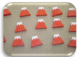
赤い富士山石けん