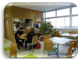
カフェ・きいちご

12月7日、「きいちごツアー」と称し、メンバー3名、スタッフ1名で「カフェ・きいちご」に見学に行きました。島田の新しいビル「おびりあ」と、こころの新しい就労施設でメンバーの頑張っている姿を見るのが目的です。メンバーは、車の中から、島田のきれいな街並みや、新しい「おびりあ」に感激～「いいなあ～」とため息の連続でした。