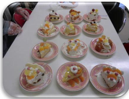
ケーキコンテスト