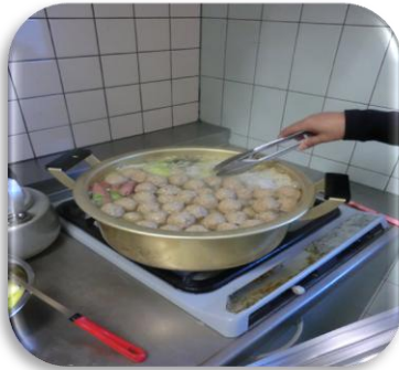
スペシャル(鍋)ランチ

「ケーキ投票が初めてで楽しかった」「役割分担が上手にでき良かった」との感想もありおいしく楽しくできたクリスマス会でありました。