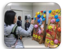
風船ダーツゲーム