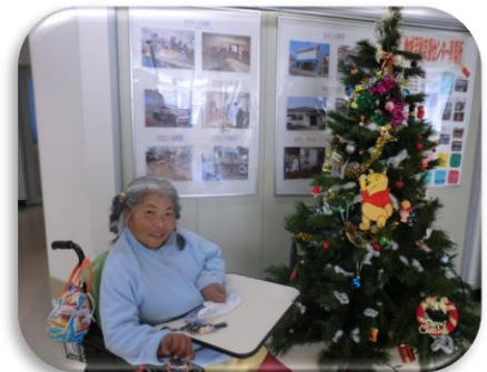
クリスマスツリーキレイでした!