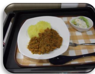
～きいちごのキーマカレー～