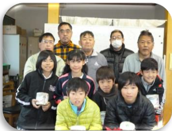
～福祉委員の皆さんとはぐるまメンバー～

川崎小学校の皆さんの善意のお気持ちと、はぐるまに来ていただいた事に感謝して、大切に使用させていただきます。ありがとうございました。