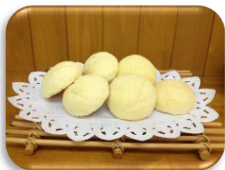
～うえるのメロンパン～