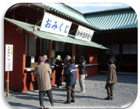
～浅間神社にて初詣～