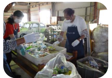
ペットボトル仕分け作業

中作業は、今月は手提げ紙袋のリサイクルが主でした。取手と紙を分ける作業です。最初は慣れずに時間がかかっていましたが、日に日に皆のペースが早くなり、山積みの紙袋を2週間で分け終わることが出来ました。メンバーさんからは「疲れることもあるけど、やっただけの成果が目に見えるから嬉しい」という声が聞かれました。これからも少しずつ作業に慣れるよう、皆で力を合わせてやっていきたいと思えます。