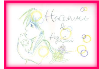
はぐるま S.N さんの作品