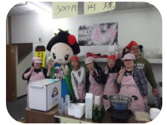
おしまちゃんとメンバー