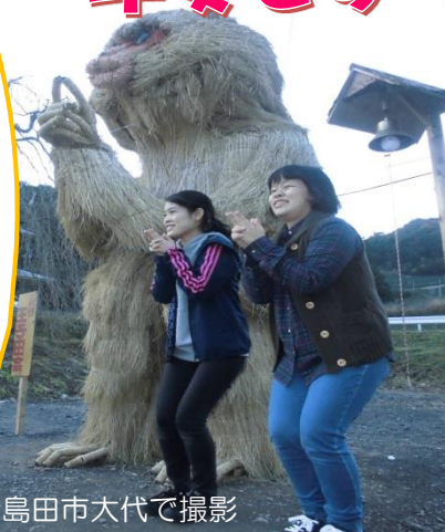
※島田市大代で撮影