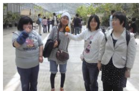
就労移行支援 掛川花鳥園見学