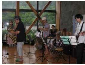
断酒会へバンドクラブ参加