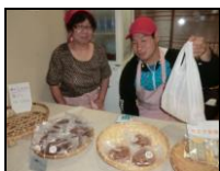
就労移行支援 荷縄屋にてパン販売

5月末現在、定員の10名を超える12名の方が利用登録をしていますが、毎日通える人ばかりではないため、曜日によっては4~5名という日があります。利用登録8名の就労移行とともに、利用者の安定確保が運営(経営)上の課題ではありますが、就労は長い人生の中の選択肢の一つ、その人自身が希望する自分らしい人生を送るために、ひとりひとりの気持ちに沿った支援をしようと考えています