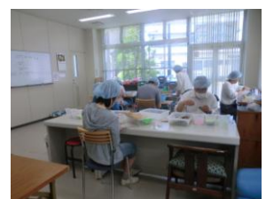
新作業室でのB型作業