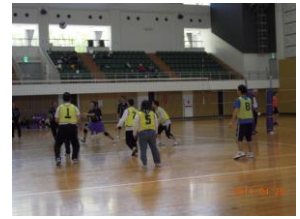
バレーボール大会参加