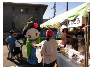
金谷産業祭での販売