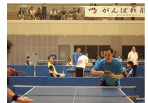
スポーツ大会参加