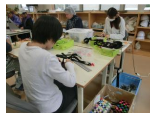
ポチ(ミニバック)作り