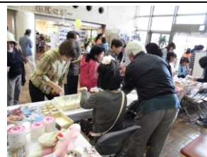
島田ふれあい広場での販売

開所から2年半、当初より利用者数や作業時間の増加だけでなく、メンバーが目標に向かって、そして、責任をもって作業に取り組む事業所にと、メンバーとスタッフで協働して変化(成長)してきました。