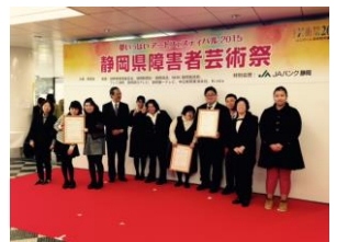
授産製品コンクール

平成27年度静岡県授産製品コンクールにおいて出品製品3点がすべて受賞することができました。法人の自主製品のコンセプトである、① ころろがほっと(HOT)する。② 地球とからだにやさしい。③ ひと・もの・ころろをつむぐに沿って作られている自主製品です。