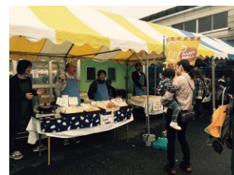
JAハイナン菅山での販売