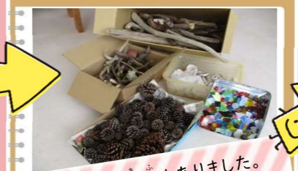
皆さんからの寄付もありました。ありがとうございました。