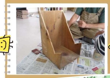
看板を置く土台も手作り☆ 「うちに使えそうな木箱があるよ」とメンバー! 廃材の有効活用!SDGs☆