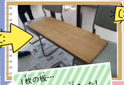
一枚の板...ここから全ては始まった!

「島地活にも看板があるし、はぐるまを象徴する看板を作ろうよ! 法人のホームページのアイコンにもしたい!」という声から、地域活動支援センターはぐるまでも看板作りがスタートしました。