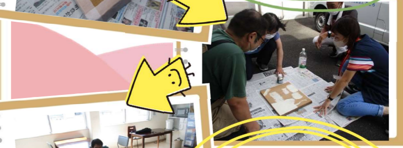
何度も何度も試行錯誤。迷ったらみんなで話し合い。そして「とりあえずやってみよう!」の精神で乗り切りました。

自分のペースで参加できた。「ちょっと休みたいから、今日はお願いね」が言えたことが良かった。