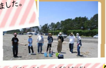
流木を拾いに静波海岸へ!