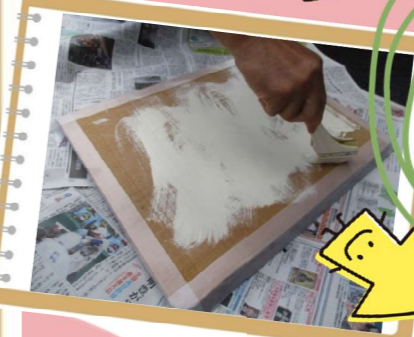
ペンキ塗り!一枚は綺麗に仕上げ、もう一枚はメンバー全員が一人一筆にしてそれぞれ思いのまま色を塗りました。

スタートしたばかりの頃は、本当に自分たちにできるのか!?という不安でいっぱいでした。それが、終わってみれば「自分たちにもできた!自信に繋がった!」とみんなでにっこり笑顔。仲間のストレンクスがたくさんつまった看板です。 《次号はストレンクス特集です!!》