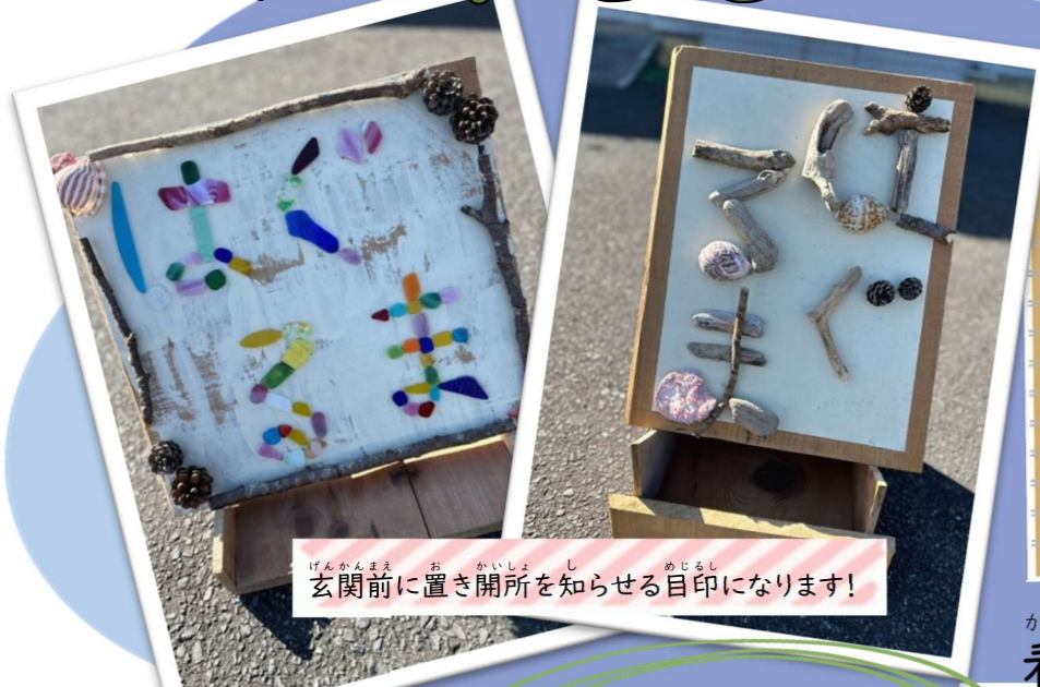
玄関前に置き開所を知らせる目印になります!

「島地活にも看板があるし、はぐるまを象徴する看板を作ろうよ! 法人のホームページのアイコンにもしたい!」という声から、地域活動支援センターはぐるまでも看板作りがスタートしました。