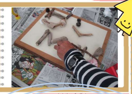
いよいよ完成間近! 何だか緊張するー!! この頃にはメンバーの結束力も一段とアップしていました☆