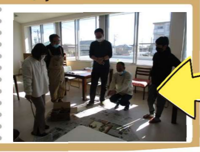
デザインどうしよう...。悩んでは、やってみる...その繰り返し!

自分のペースで参加できた。「ちょっと休みたいから、今日はお願いね」が言えたことが良かった。