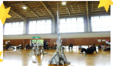
傑作! こころタワー!!