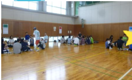
10 チームに分かれて、チーム名考え中