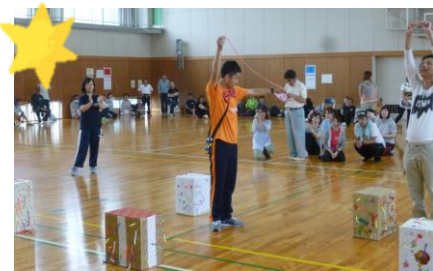
ながと 長いのが取ったどー! これで優勝確実