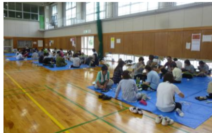
チームでお弁当を食べ、交流タイム