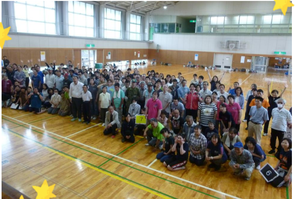
参加者総勢145名 おおにぎ 大賑わいでした!