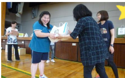
やったね! これで豪華景品ゲットだぜ!