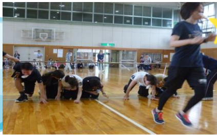
パン食い競争 異常に低かったです