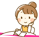
地域活動支援センター