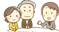
地域包括支援センター