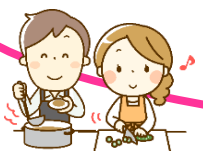
ヘルパー、その他の社会資源