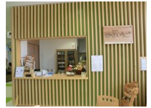
カフェ・きいちご

火～日 10:00～16:00 島田市本通り3丁目3-3 島田市おびりあ4階の子ども館内にある喫茶コーナーです。 当事者とスタッフで軽食、こだわりのコーヒー、スープ、 アイスクリームなどを販売しております。