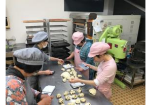
ベーカリー・うえる

月～金 9:00～16:00 月～金 11:00～16:00 島田市金谷中町2100-1