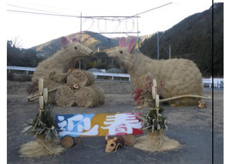
島田市大代の干支（子）

昨年の「こころ通信 1月号」で、今年目標を「発信と固める」としました。まさに、それを実行した1年だったと思います。特に「発信」では、日ごろの実践を職能団体の全国大会やリカバリーフォーラムで報告、また就労の取組を圏域研修で報告、ピアスタッフは多くの機関や団体からの依頼によってリカバリストーリーや実践報告をする機会を得ました。また、こころの取組が新聞掲載によって発信され、大きな反響もありました。