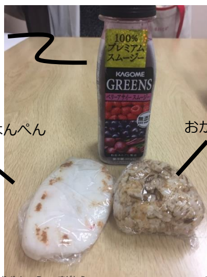
桜エビ入りはんぺん