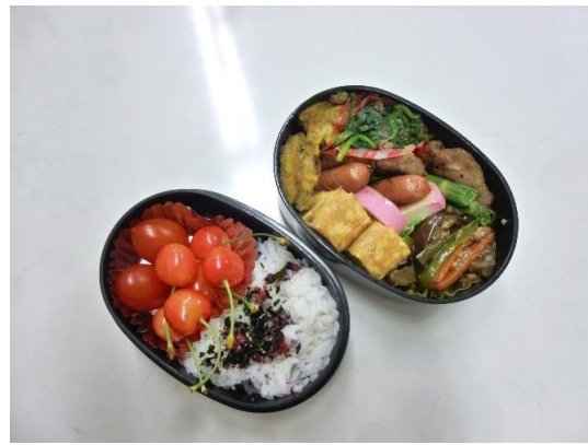
これは撮影用ではありません！ 「就 B ことむぎ松村さん」のセンスが映えるお弁当