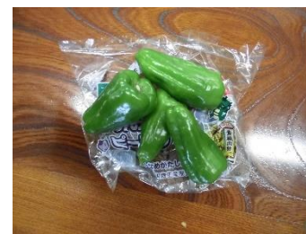
完全ベジタブル主義！