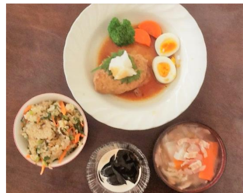
地活はぐるまランチ渾身の1枚 ランチの醍醐味は、みんなで同じ釜の 飯を食べること、その過程！