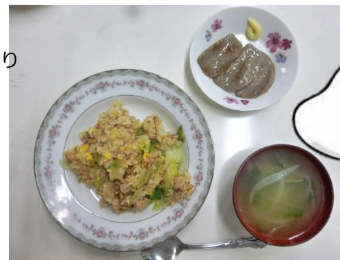
島地活のランチは、みんなで作れば 何でもおいしい(はず)