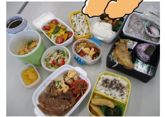
みんなこの日のために作りました(笑) 就 B あじさいは、名前通りで、 お弁当が彩り豊かです。