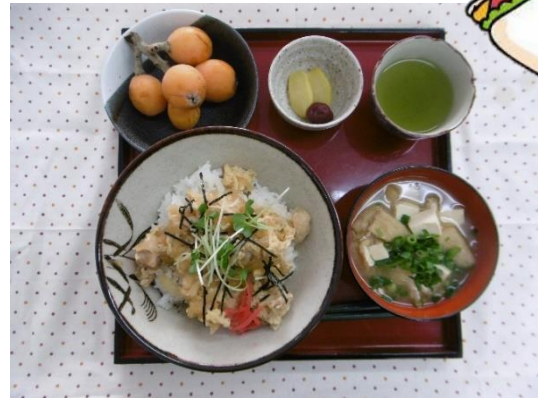
就 B ドレミは、毎週木曜日が調理の白で、 担当の人が調理します