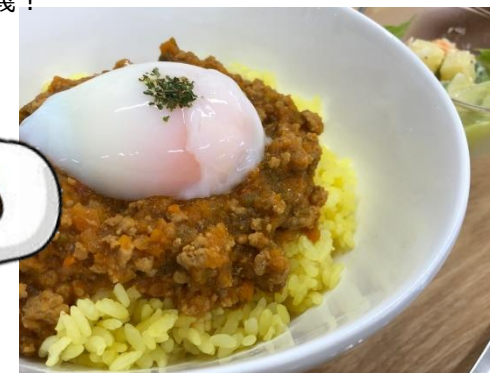
就 B りなむのランチは、 撮り方キレイ (これ、宣伝用)