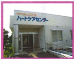
ハートケアセンターココロ こむぎ