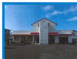
はぐるま・あじさい