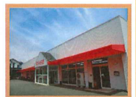
ワークステップドレミ