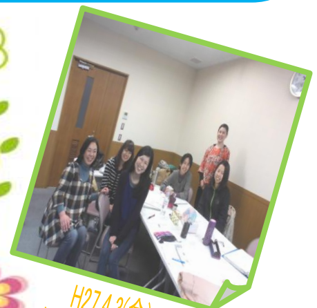
H27.4.3(金) 南交流センターにて

4月3日に相談室こころの相談員が集まり、研修を行いました。研修では、制度の仕組みや相談支援の基本的な流れについて学びました。また、制度上のことだけでなく、事例を使ってサービス等利用計画を立てながら、その人がその人らしく暮らすために相談員としてどのような関わりができるかを意見を出し合い考えました。誰もが生き生きと自分らしく暮らせる地域づくりを目指して、日々の実践の一つ一つを大切にしながら取り組んでいきたいです。