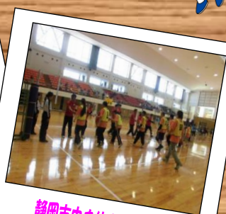
静岡市中央体育館にて

今年度最初のフットサルの練習が4月17日にありました。正式にクラブとして活動することになり、一段と気合が入っています。クラブ目標は大会参加を目指すことです。リハビリのために参加する方、仕事の間のリラックスのために参加する方、いろいろな参加の仕方がありますが、フットサルが好きなお方ばかりです。先日の練習では参加者13名でした。ドリブルと、シュート練習、その後試合を行いました。まだ時間があると「もう1本やりましょう」と声上がり次々にフィールドに出ていく姿がみえました。大会参加を目指して頑張っています！