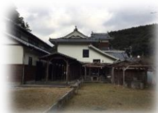
夜は法人理事のお宅を会場に地域ぐるみの大歓迎会でした!